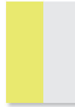
1/2 Seite hoch

R: 210 x 148 mm S: 173 x 125 mm 4f CHF 1'700