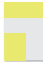
1/4 Seite quer/hoch

R: 104 x 297 mm S: 83.5 x 254 mm 4f CHF 1'700